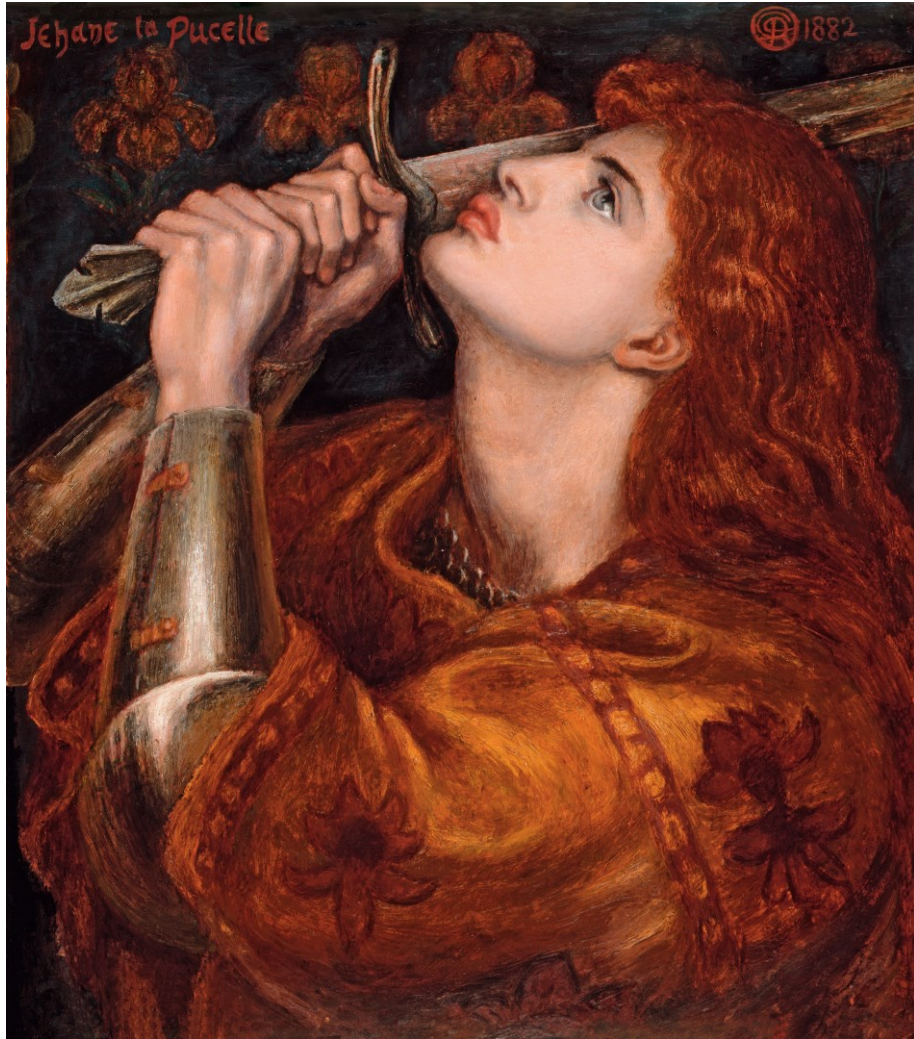
D[ante] G[abriel] R[ossetti], Jehane la Pucelle , 1882 huile sur panneau de bois – 52,7 x 45,7 cm – Fitzwilliam Museum